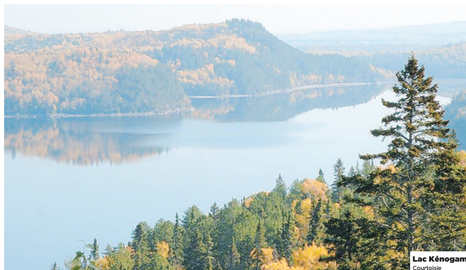
Lac Kénogami