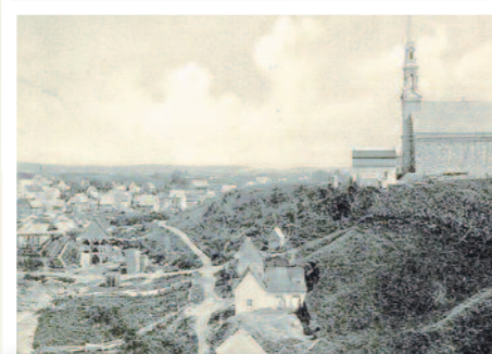
Hébertville Collection Magella Bureau, vers 1906 / BAnQ (P547,S1,SS1,SSS1,D165)