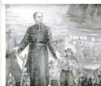
L'arrivée du curé Hébert, le 25 mai 1850 Peinture de Morency et Martirano, 1950

Considérant les difficultés de transport qu'elle a connues et le manque relatif d'aide gouvernementale, la société de colonisation du curé Hébert a réussi sa mission en établissant 150 colons au Lac-Saint-Jean et en poussant la conquête régionale du sol vers l'ouest.