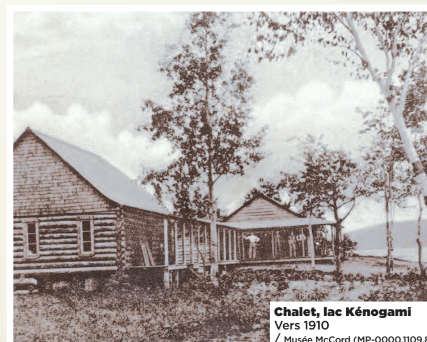
Chalet, lac Kénogami Vers 1910