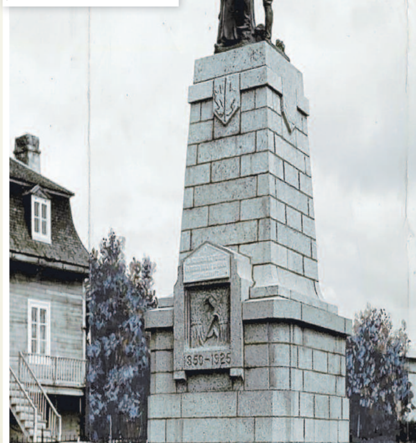
Monument « Au révérend Nicolas de Tolentin Hébert » en l'honneur des 14 premiers colons du Lac-Saint-Jean à Hébertville Fonds L'Action catholique, vers 1925 / BAnQ (P428,S3,SS1,D28,P25)