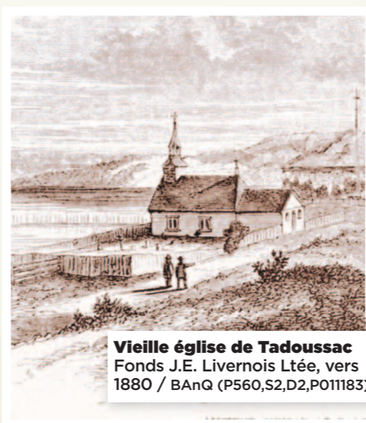
Vieille église de Tadoussac Fonds J.E. Livernois Ltée, vers 1880 / BAAnQ (P560,S2,D2,P011183)