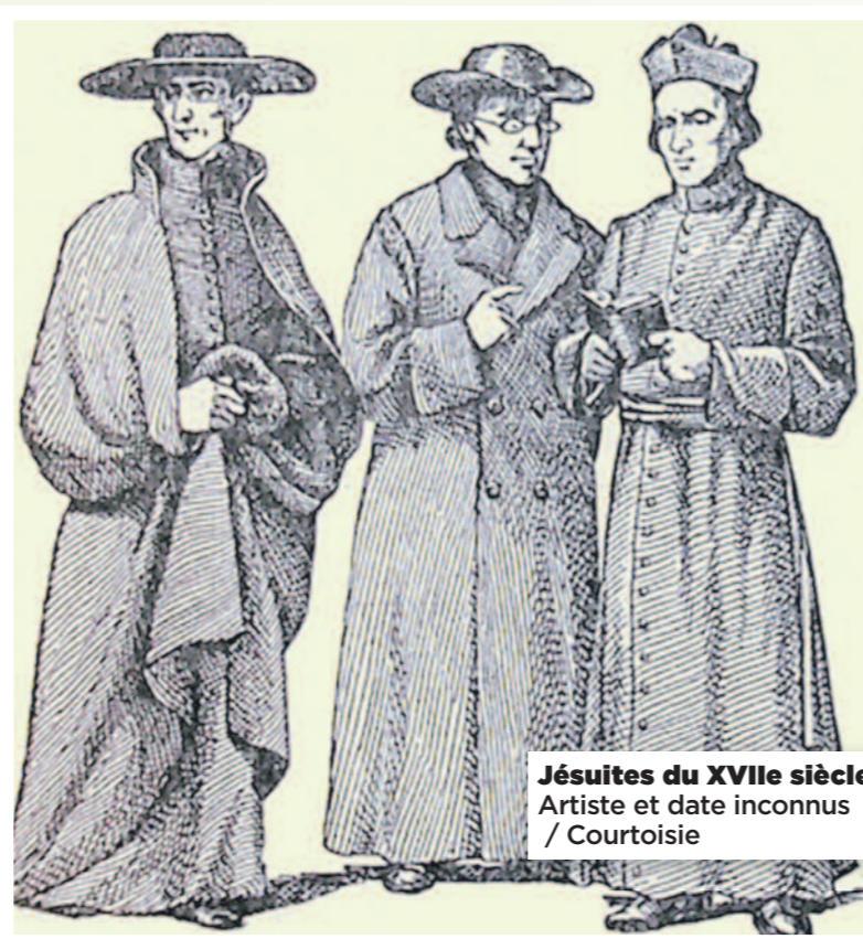
Jésuites du XVII e siècle Artiste et date inconnus / Courtoisie