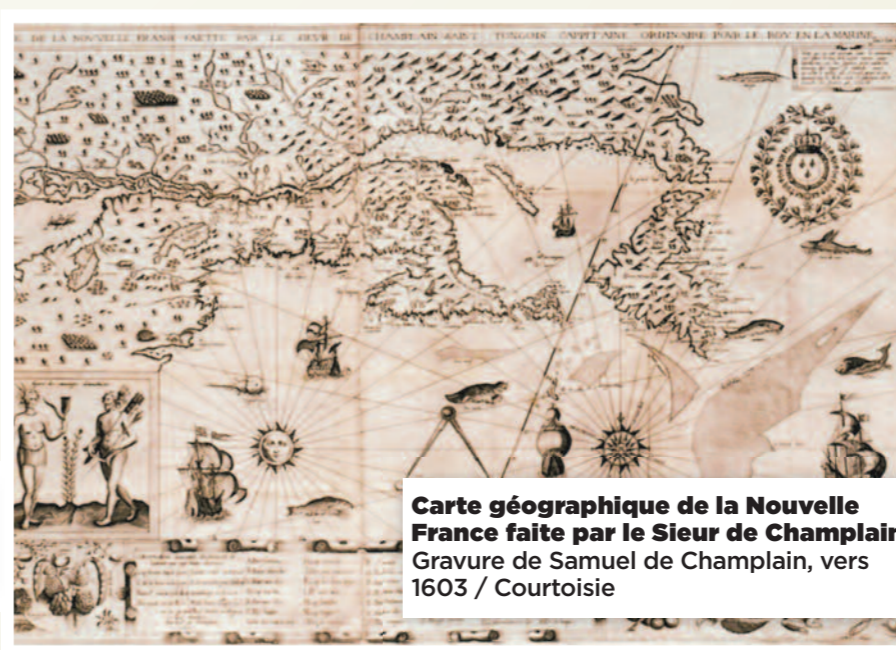
Carte géographique de la Nouvelle France faite par le Sieur de Champlain Gravure de Samuel de Champlain, vers 1603