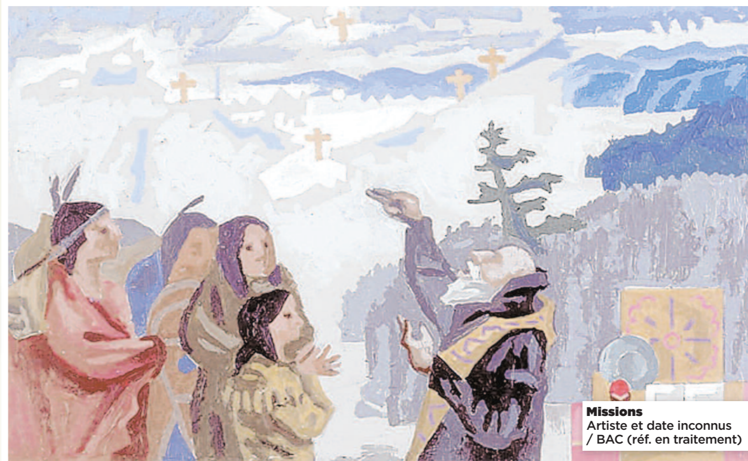
Missions Artiste et date inconnus / BAC (réf. en traitement)