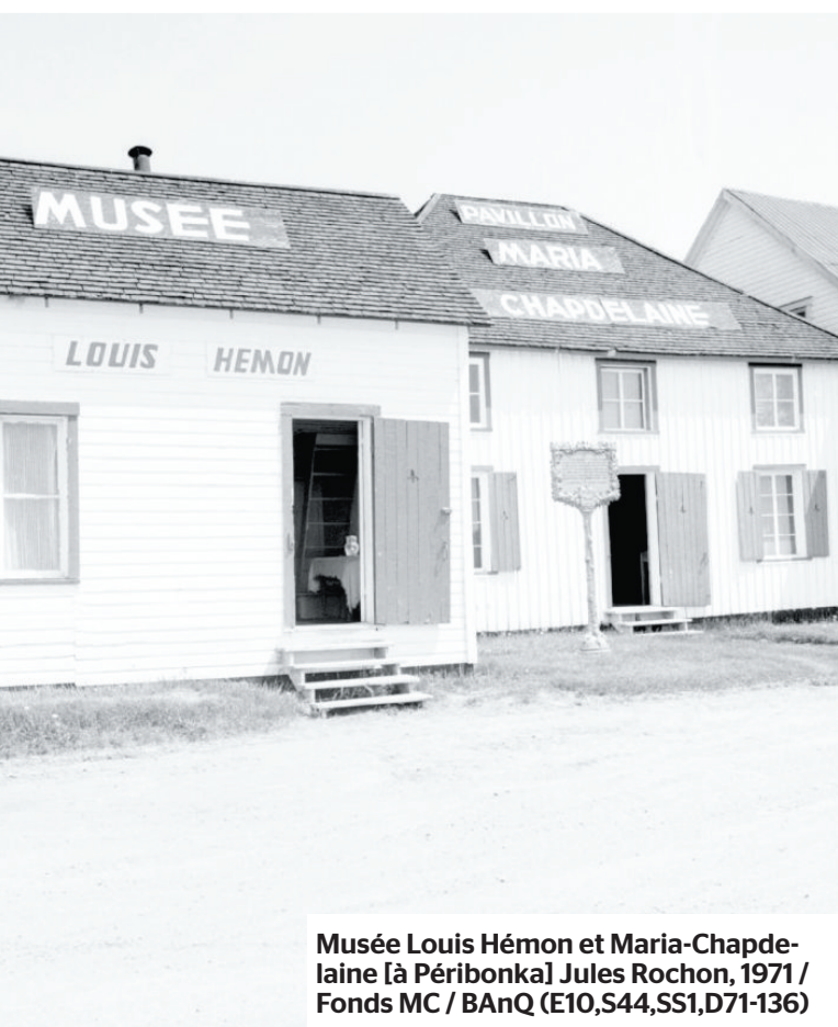
Musée Louis Hémon et Maria-Chapdelaine [à Péribonka]

Ce nouveau discours fait du roman un précurseur de la littérature engagée à laquelle il appartient, car il rompt avec les convenances bourgeoises de l'époque. Mais sa publication posthume ne pouvait qu'ouvrir la porte à une lecture erronée.