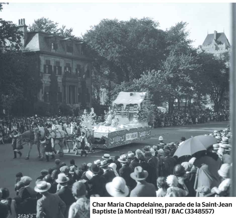
Char Maria Chapdelaine, parade de la Saint-Jean Baptiste [à Montréal] 1931 (3348557)