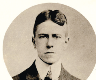
Louis Hémon Vers 1950