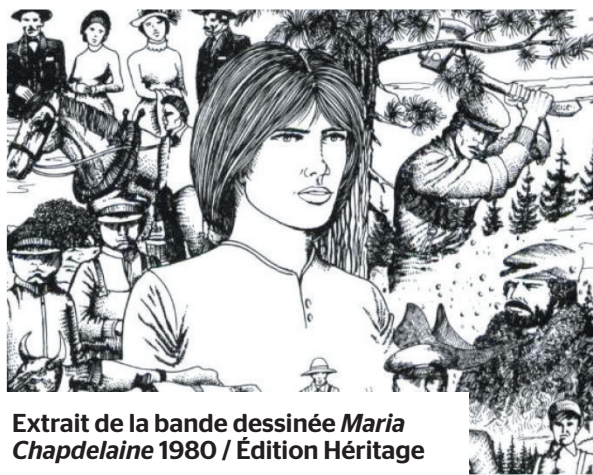
Extrait de la bande dessinée Maria Chapdelaine 1980 / Édition Héritage